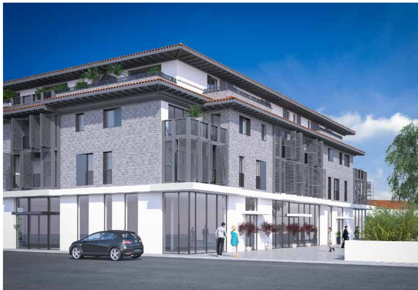
700 m 2 réservés aux commerces - Des surfaces divisibles à vendre ou à louer.

Sans vis-à-vis, disposant de vues dégagées, vous vivrez dans un quartier animé, accessible, offrant services et commerces de proximité. Un emplacement de choix proche des plages et de Biarritz.