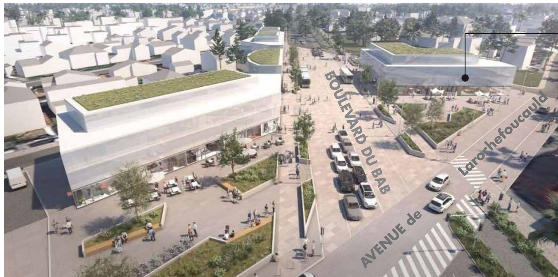
Anglet quartier Laroche foucauld - Une urbanisation concertée.

Une place de choix pour vivre au cœur de l'agglomération, aux portes de Biarritz et à deux pas des plages !